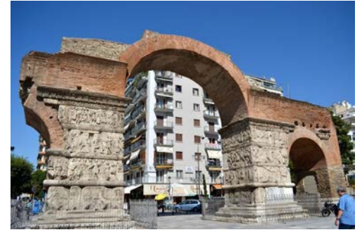
首都 of 马其顿省