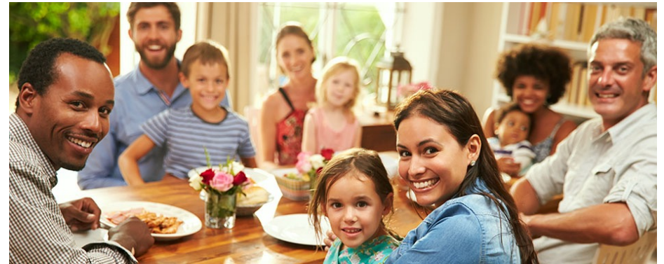
由几个个体家庭组成的大家庭